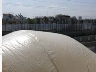
5. קרן גלר פראניאמה, 2011 טכניקה מעורבת: בד, מפוחים ומנוע חזית עלמא - מכללה עברית, בצלאל יפה 4