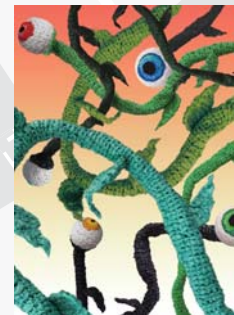
6. גיל יפמן מחזור, 2011 שקיות ניילון, פחים, בד ופלסטיק כיכר אלברט (ליד "בית הפגודה")