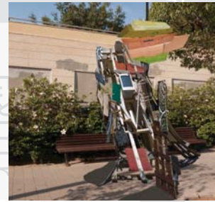
3. קבוצת "אלף אפס" (אורי לוינסון וגלי ו. חכמון) רשת חברתית, 2011 טכניקה מעורבת מזא"ה 13-11