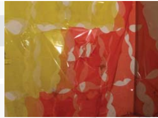
4. הילה לכיב אי אפשר לעוף עכשיו, 2011 טכניקה מעורבת: נייר צלופן וסלוטייפ רחבה אחורית, מתחם גלריה שלוש, רחוב מאז"ה 9-7