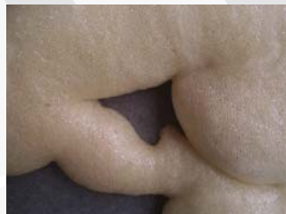
7. טל פרנק Under construction, 2011 טכניקה מעורבת: פוליאוריטן מוקצף וצבע רחבת רובע לב העיר, מזא"ה 5