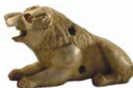
עיטור רהיט: אריה רובץ שומרון, המאה ה-9 עד ה-8 לפני הספירה, שנהב רשות העתיקות אולם ישראל בימי התנ"ך