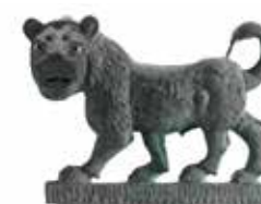
אחד משני אריות שהוקדשו לאל המלחמה עת'תר, בעל אד'נון, על ידי ידעאב וישהרמלך, מלכי נשן חקוקים במעינית־שבאית בכתב דרום ערבי, נשן (היום: אל־סודאן, צפון תימן), המאה ה־6 לפני הספירה בקירוב, ברונזה אוסף שלמה מוסיוף 📍 אולם התרבויות השכנות