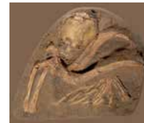
קבורת נער עם קרני אייל (יציקה מן המקור)

מערת קפזה, התרבות המוסטרית, לפני 92,000 שנה מוזיאון ישראל, ירושלים: מתנת המרכז הצרפתי למחקר פרהיסטורי בירושלים אולם בשחר התרבות