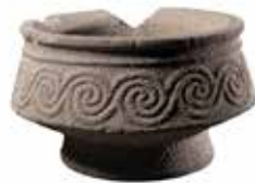
אגן נסך מגולף בעיטור סלילים מקדש האורתוסטיים, חצור, המאה ה-15 עד ה-13 לפני הספירה, בזלת רשות העתיקות אולם ארץ כנען