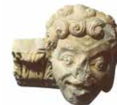
חלק כרכוב בדמות ראש נער מחייך כוכב הירדן, המאה ה-12, שיש ושרידי צבע רשות העתיקות אולם מוסלמים וצלבנים