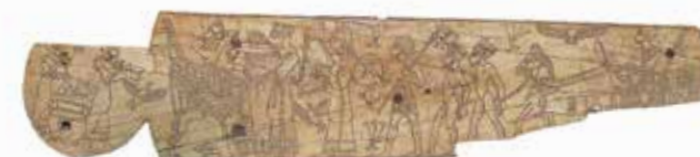
לוחית שיבוץ ועליה תיאור עלילתי, שגיבורו הוא שליט כנעני תל מגידו, 1130-1300 לפני הספירה, שנהב רשות העתיקות אולם ארץ כנען (כרגע לא בתצוגה, תוצג בתערוכה "המשתה")