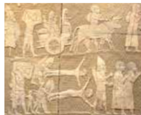
תבליט לכיש (פרט, העתק)* נינווה, אשור (היום: צפון עיראק) ראשית המאה ה-7 לפני הספירה רשות העתיקות *התבליט המקורי שמור במוזיאון הבריטי, לונדון אולם ישראל בימי התנ"ך