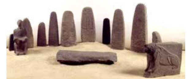
שחזור "מקדש המצבות" חצור, המאה ה-14 עד ה-13 לפני הספירה, בזלת רשות העתיקות אולם ארץ כנען