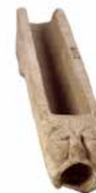
מרזב שבקצהו ראש אריה אשקלון, המאה ה־12 לספירה, שיש רשות העתיקות 📍 אולם מוסלמים וצלבים