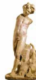
סטיר עם פנתר קיסריה, המאה ה-2 לספירה, שיש רשות העתיקות אולם תחת שלטון רומא