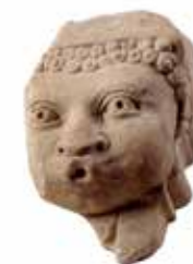
אבן-מסעד בדמות ראש אדם נושף עכו, המאה ה-13, שיש רשות העתיקות אולם מוסלמים וצלבנים