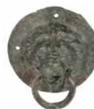
ידיד בדמות אריה מוצא לא ידוע, המאה ה־2 לספירה, ברונזה מתנת ארנולד גלימטשער ורעייתו, ניו־יורק, לידידי מוזיאון ישראל בארה"ב 📍 אולם התרבויות השכנות < עמי איטליה