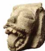
אבן-מסעד בדמות ראש מפלצת חורצת לשון עכו, המאה ה-13, אבן רשות העתיקות אולם מוסלמים וצלבנים