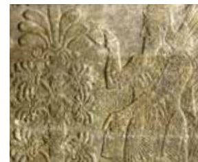
תבליט קיר (פרט) כלח (תל נמרוד), אשור (היום: צפון עיראק), ימי אשורנצרפל השני, המאה ה-9 לפני הספירה, בהט מוזיאון ישראל, ירושלים: מתנת הברון והברונית אדמונד דה-רוטשילד, פריז אולם התרבויות השכנות < המזרח הקדום