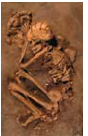
קבורת אישה עם כלב (יציקה מן המקור)

מערת קפזה, התרבות המוסטרית, לפני 92,000 שנה מוזיאון ישראל, ירושלים: מתנת המרכז הצרפתי למחקר פרהיסטורי בירושלים אולם בשחר התרבות