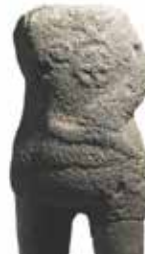
פסל אל הסער על גב פר (פרט) מקדש האורתוסטיים, חצור, המאה ה-15 עד ה-13 לפני הספירה, בזלת רשות העתיקות אולם ארץ כנען