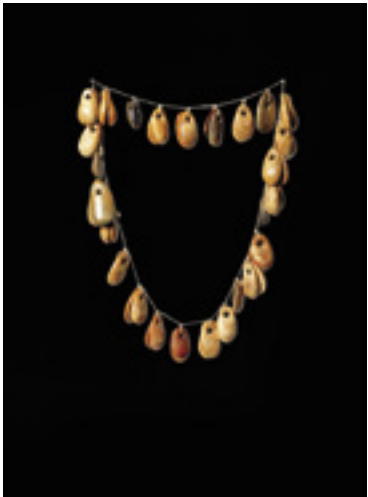
מחרוזת נטיפות, מערת היונים, התרבות הנטופית, 14,500 שנים בקירוב לפני זמננו, עצם, רשות העתיקות

הצורך להתקשט מעיד על התפתחות המודעות העצמית של האדם. בני כל החברות האנושיות עונדים תכשיטים, מקשטים את בגדיהם או צובעים את העור ומקעקעים אותם. הם עושים זאת כדרך לביטוי העצמי, כאמצעי ליצירת זהות קבוצתית ולמשיכת בני ובנות זוג, להגנה ולזיכרון. תכשיטים עשויים להעיד על מגדר, גיל, מעמד חברתי, הישג מיוחד, ובמקרים רבים על כמה דברים יחד. התערוכה מציגה את ההתקשטות האנושית מראשיתה לפני כ-120 אלף שנה - עם העדות הקדומה ביותר מחוץ לאפריקה לתכשיט תלוי - ועד לתקופה הכלקוליתית לפני כ-6,500 שנים. ממצאים נדירים נוספים שופכים אור על קעקועים וצביעת גוף, שהיו נפוצים מאוד אך נעלמו כמעט כליל מן התיעוד הארכאולוגי, ומוצגים אתנוגרפיים מלמדים על דרכי השימוש בתכשיטים בחברות הקדומות.