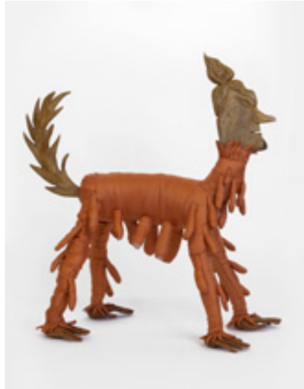
כלבת עטינים כתומה , 2020, עץ ואריג, רכישה בנדיבות קבוצת "כאן עכשיו" לרכישת אמנות ישראלית