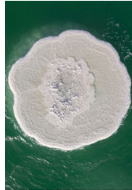
סיגלית לנדאו, אי שמש (גשר II), 2022, פרט מתוך מיצב וידאו, אוסף האמנות

הבניין לאמנות מודרנית ולאמנות עכשווית ע"ש נתן קמינגס האוצרת: אמיתי מנדלסון דפדפות בעברית, בערבית ובאנגלית