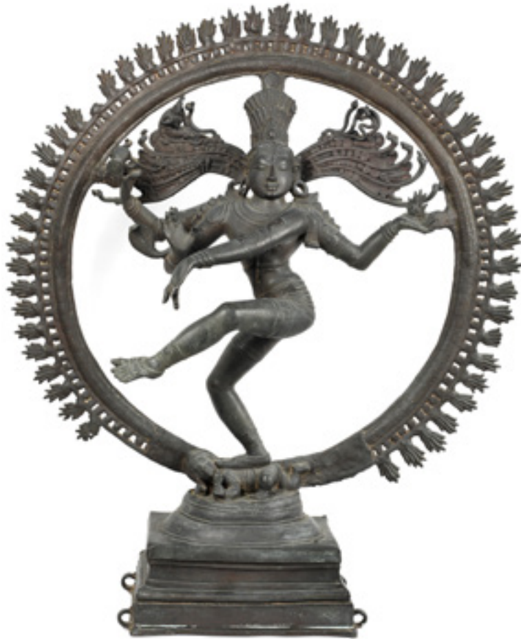
שיווה מלך הרקדנים, טמיל נאדו, המאה ה־12 ברונזה, המוזיאון הלאומי, ניו דלהי