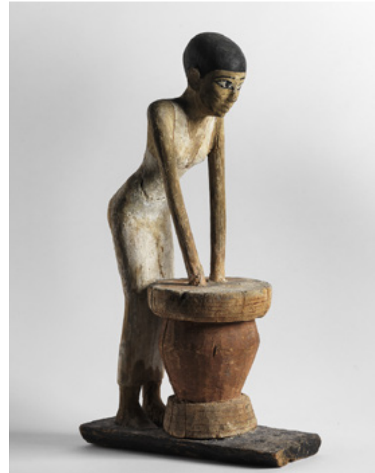
פסלון אישה לשה את חומר הגלם ליצירת בירה, מצרים, המאה ה-21 עד ה-20 לפני הספירה

כמו בימינו, גם בעת העתיקה היה למשתה או לסעודה המלכותיים תפקיד חברתי-פוליטי מכריע בביסוס מעמדו של השליט והאידיאולוגיה שלו. באמצעות הפצים, תיאורים איקונוגרפיים, ממצאים כתובים וממצאים אורגניים (שאריות מזון) התערוכה משרטטת את הכללים החברתיים שנהגו בסעודות המלכות במזרח הקדום משנת 2700 עד 400 לפני הספירה בקירוב. הסעודות והמשתאות נחלקו לשני סוגים: אחד המוני, שבו הזמינו המלך או המנהיג הרוחני את המון-העם לחגוג ניצחון צבאי, הישג משמעותי או טקס דתי. במשתה מן הסוג הזה היה על השליט לעמוד בציפיות אורחיו. אם הצליח, התחזק מעמדו באמצעות יצירת סולידריות בקרב ההמון, שביססה את תחושת שייכותו ליחידה פוליטית אחת תחת סמכות השליט. לסוג השני, האקסלוסיבי, הוזמנו אנשים נבחרים בלבד והוא הדגיש את ההיררכיה המעמדית בקרב המוזמנים המכובדים מכאן ובקרב אלה שלא זכו להשתתף במשתה מכאן. המבקרים בתערוכה מוזמנים לגלות את מנגנוני הפעולה של המשתה המלכותי בעת העתיקה ולזהות מנגנונים דומים גם בסעודות ממלכתיות בימינו.