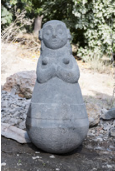
זוהר גוטסמו, נופל זקם, 2022, בזלת, אוסף האמן