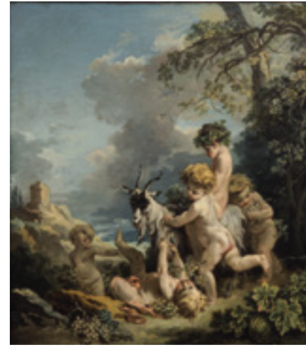
פרנסואה בושא , אלגוריה של סתיו: פוטי משחק עם עז, 1730 בקירוב, צבעי־שמן על בד, עיזבון אלקסיס גרגורי, ניו־יורק, לידידי מוזיאון ישראל בארה"ב

ארקדיה, ארץ הרועים היוונית, תוארה באמנות אירופה לא רק כמקום גאוגרפי ממשי אלא כמחוז פסטורלי ושלו, שנימפות, סאטירים וקופידונים דרים בו בכפיפה אחת עם בני־אדם וחיות. העת המופלאה והדמיונית הזאת כונתה גם "תור הזהב", משום שלא היו בה מחלות ומלחמות והשלום וההרמוניה שררו בה. מאות שנים ובעיקר במאה ה־17 וה־18 ניסו ציירים, רשמנים ודפוסים ברחבי אירופה לתאר את האידיליה הזאת ביצירותיהם, לא פעם בהשראת נופי דרום איטליה שטופי השמש. בתערוכה יצירות מאת אמני המופת אניבלה קראצ'י, פרנסואה בושא, ז'אן־אונורה פרגונר ואחרים.