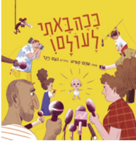
נעם ויינר, "ככה באתי לעולם", 2021